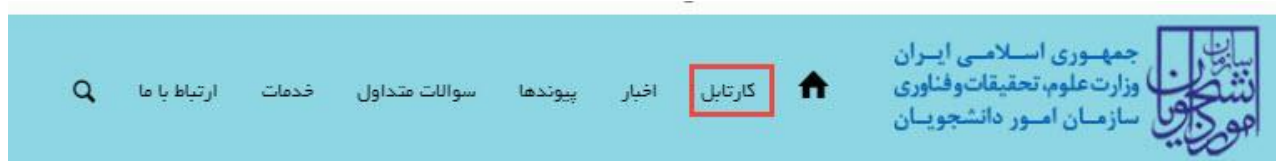
تصویر ۹- کارتابل شخصی

با دریافت پیغام جهت مراجعه به پورتال، برای مشاهده وضعیت خود اقدام نمایید. از طریق پورتال سازمان امور دانشجویان سربرگ کارتابل را انتخاب نمایید. (تصویر ۹)