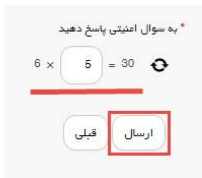
تصویر ۵- سوال امنیتی

سپس به سوال امنیتی پاسخ داده و بر روی دکمه ارسال کلیک کنید. (تصویر ۵)