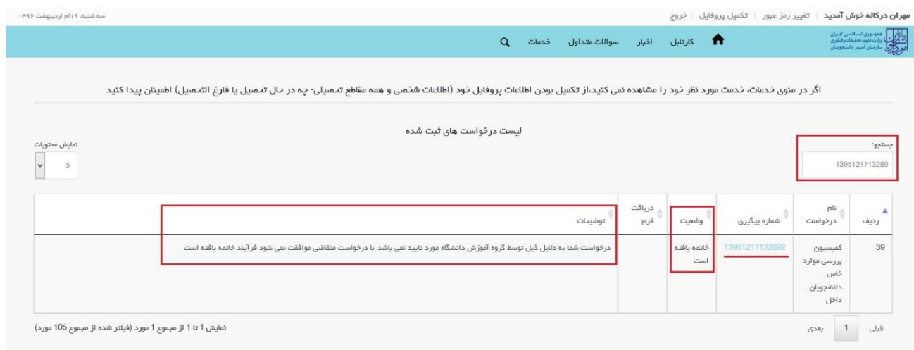
تصویر ۱۳-عدم تایید درخواست

۲. در صورتی که کارشناس آموزشی دانشگاه (در مرحله بررسی اولیه درخواست و مدارک متقاضی) اعلام عدم تایید درخواست نماید.(تصویر ۱۳)