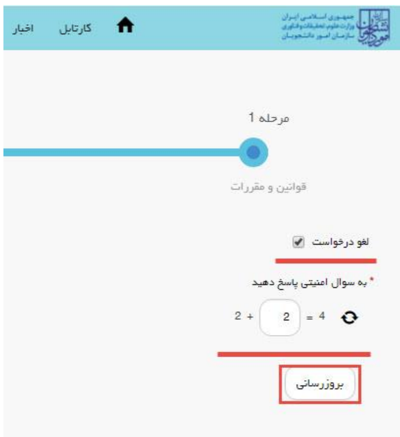
تصویر ۱۲-لغو درخواست

همچنین می توانید با انتخاب گزینه لغو درخواست نسبت به لغو فرآیند اقدام نمایید.(تصویر ۱۲)